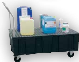
EURO-PE mobile avec caillebotis acier galvanisé