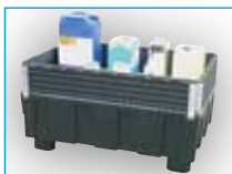
1 Réhausse EURO-PE