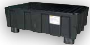
EURO-PE avec 4 pieds et caillebotis en polyéthylène