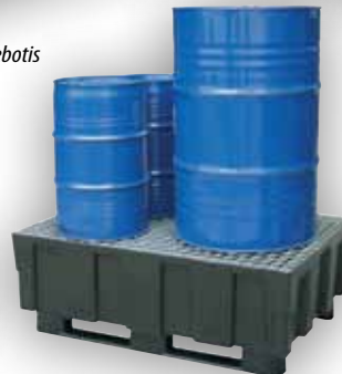
EURO-PE avec 2 patins et caillebotis acier galvanisé