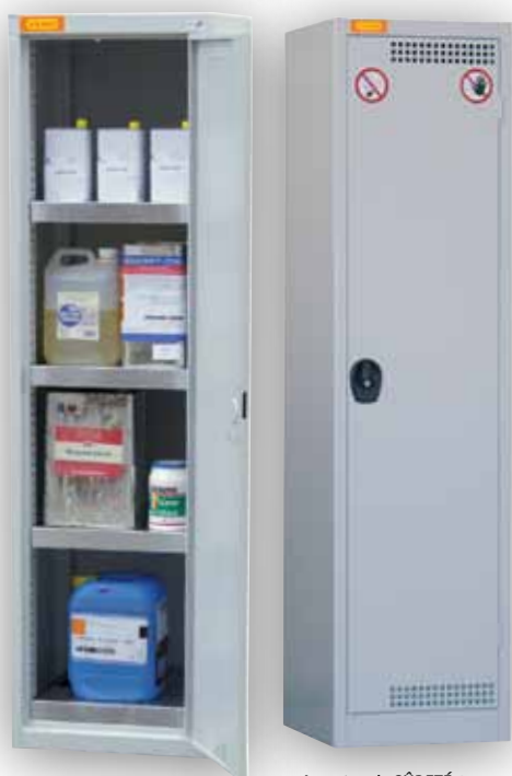
Armoire de SÛRETÉ 1