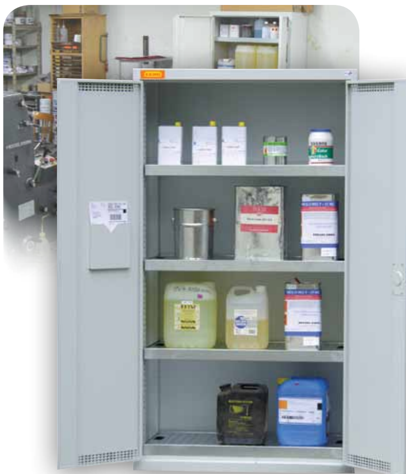
Armoire de SÛRETÉ 2

Ne convient pas pour le stockage de produits inflammables.