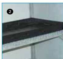
Bac PLAT PE 40