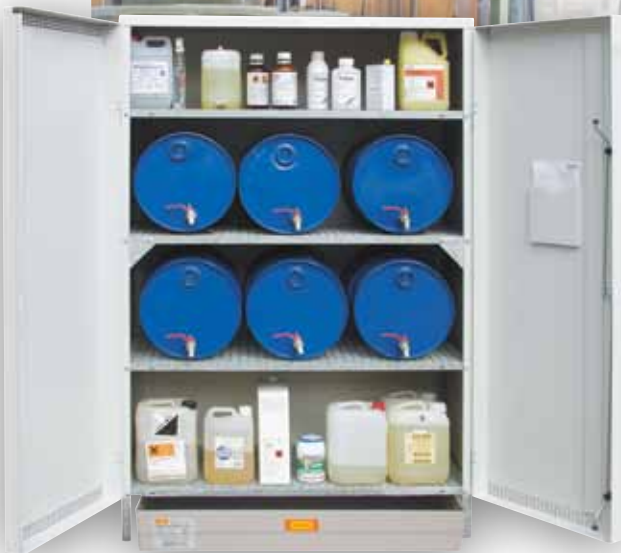
Armoire de SÛRETÉ Fort 4