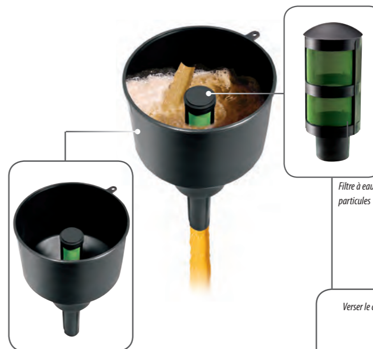
Filtre à eau et particules