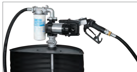
Pompe Cematex 12 V