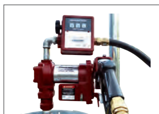
Pompe ATEX 12 V avec compteur