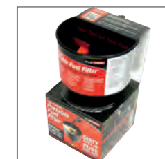
Entonnoir filtration essence 13 l/min