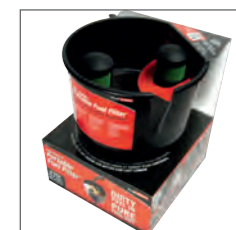
Entonnoir filtration essence 45 l/min