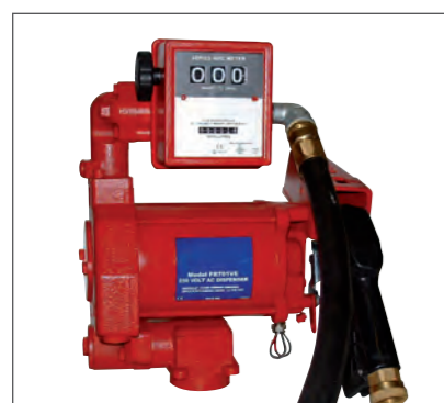
Pompe ATEX 230 V avec compteur